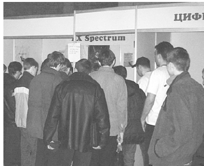
Ажиотаж у места проведения чемпионата.

Время пришло, пора начинать. Наконец-то все утомленные ожиданием дорвались до регистрационных листов. Первая тройка игроков приготовилась к сражению с инопланетной расой. Я скомандовал: «Взяли джойстики, приготовились, начали!» Правила игры были прежними, что и вчера.