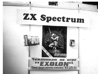
Стенд ZX-Spectrum «Sinclair Club'a».

В 14.00 начался второй тур. Никто не суетился и не толкался, спокойно сменялись тройки игроков. Играли так же по 5 минут, начиная с первой зоны. Участники заметно волновались и были максимально сосредоточены во время игры. Некоторые смекалистые находили хитрые лазейки, для экономии времени. Мастерски используя лифты, обходили сложные участки, не утруждая себя на подрыгивании ракет и других препятствий. Кто-то заметил что прыгающий космонавт движется быстрее и при возможности это использовали. Приятно было видеть тот неподдельный азарт и стремление к победе.