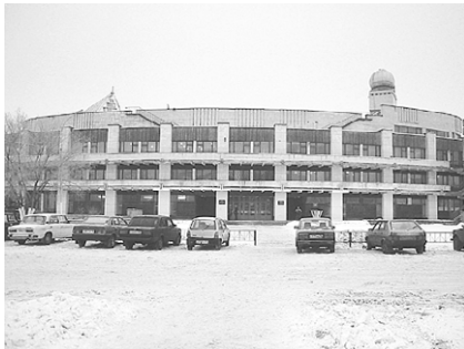
Дворец Детей и Юношества.

Я тут впервые. Города не знаю и поэтому сразу соглашаюсь на предложение «бомбилы» докатить до Дворца Детей и Юношества за 100 рублей. Едем, стараюсь запомнить дорогу. Обычно у меня это получается. Действительно, ничего сложного. Буквально через пять минут выдавшая виды «Ауди» подруливает к округлому зданию «из стекла и бетона». Дворец Детей и Юношества оправдыва-