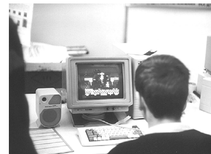
В процессе игры в «Exolon».

Награждение Exolon'овцев было заключительным в церемонии чествования победителей. Когда я сказал в микрофон: «Дорогие участники!», вдруг наступила тишина, и все устались на меня. Что это такое я сказал?.. А сказал я, что в 1998-м году состоялся единственный тогда на весь год на Спектруме фестиваль компьютерного искусства. Имен-